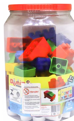
Ref. 156 Pense Monte Brinque 72 pçs Ø 13,0 x A 21 cm Embalagem: Pote plástico Código de Barra: 789836173-156-4 Caixa Master: 24 peças