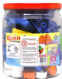
Ref. 155 Pense Monte Brinque 50 pçs Ø 12,0 x A 14,5 cm Embalagem: Pote plástico Código de Barra: 789836173-155-7 Caixa Master: 36 peças