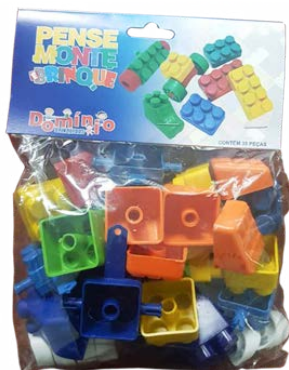
Ref. 154 Pense Monte Brinque 30 pçs A 25,0 x L 18,0 x C 5,0 cm Embalagem: Solapa Código de Barra: 789836173-154-0 Caixa Master: 60 peças

Blocos de montar são educativos, estimulam a criatividade e a coordenação motora.